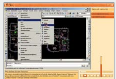
JOS - Job Open with Sign Language