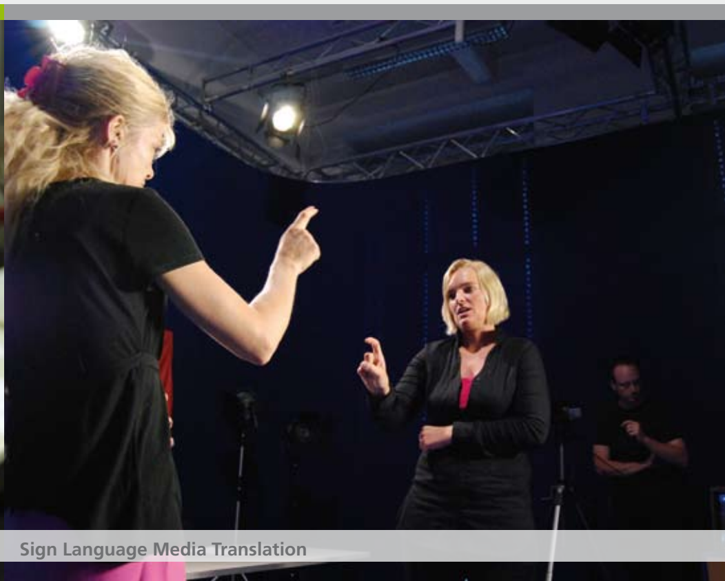
Sign Language Media Translation