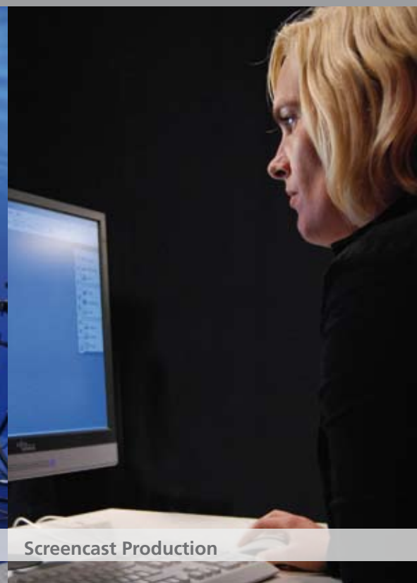
Video & Audio Production