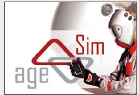
Alterssimulator | AgeSim