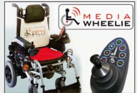
MedienRolli | MediaWheelie