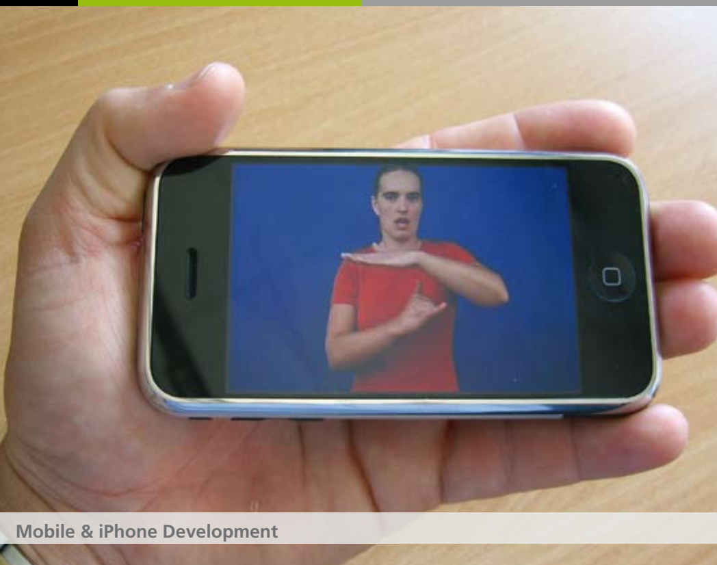
Mobile & iPhone Development