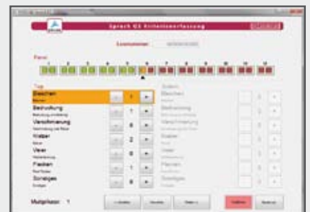
EPCOS Sprachsteuerung | EPCOS Voice Control