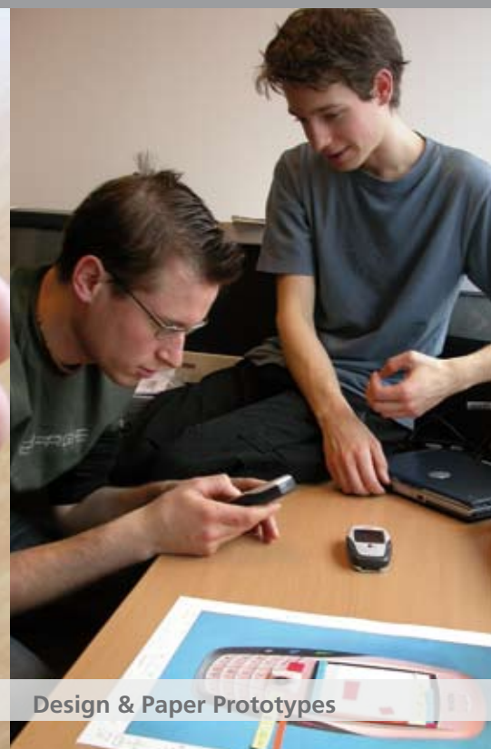
Design & Paper Prototypes